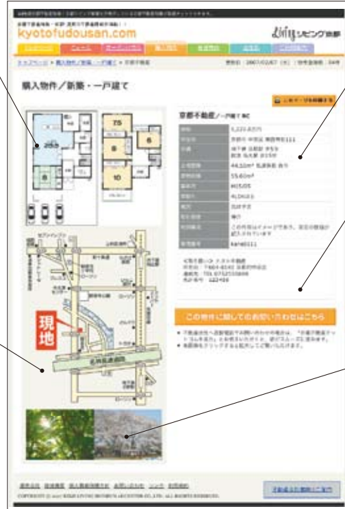
※画面はイメージです