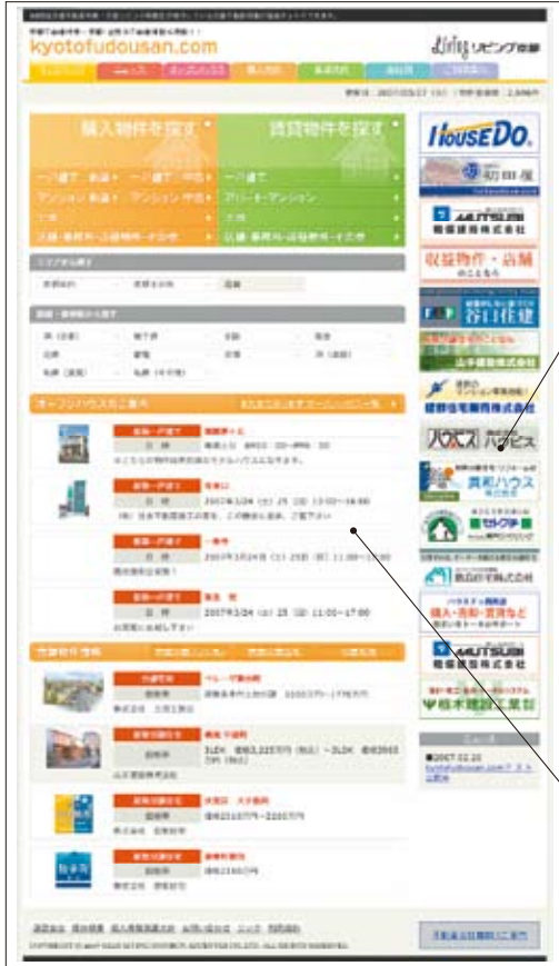
※画面はイメージです